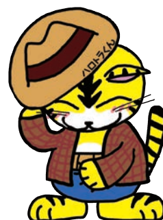
ハローワーク墨田 マスコットキャラクター ハロトラくん