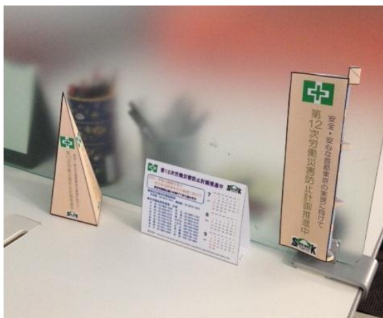
受付窓口に卓上グッズ (スタンド、カレンダー、のぼり旗)を配置