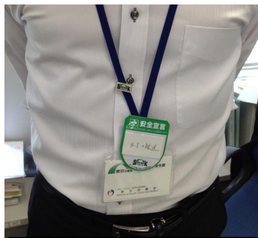
職員は「安全宣言ワッペン」を着用

※「徽章」、「のぼり旗」、「安全宣言ワッペン」は取組の趣旨に賛同した中央労働災害防止協会が作成・販売しているもの。その他については東京労働局が作成、ホームページからダウンロードが可能。