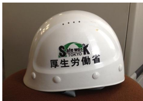
職員用ヘルメットにロゴマークを貼付