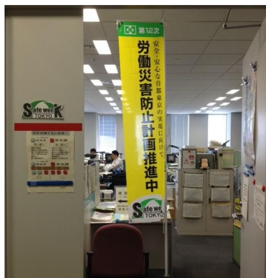
事務所に「のぼり旗」を掲示