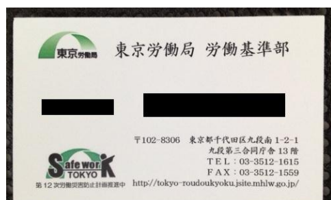
職員用名刺にロゴマークを挿入