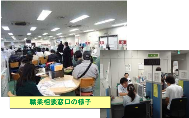
職業相談窓口の様子