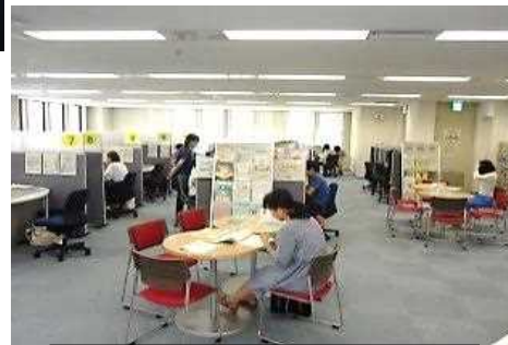
わかものハローワーク