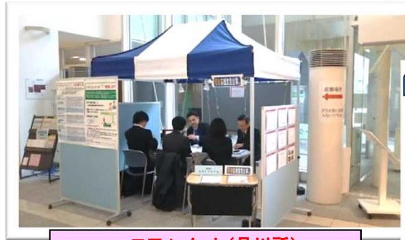
ハロワdeメッセ(品川所)