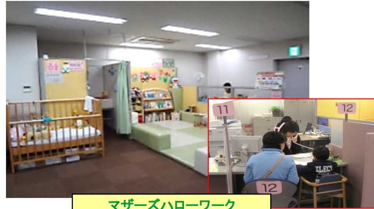
マザーズハローワーク