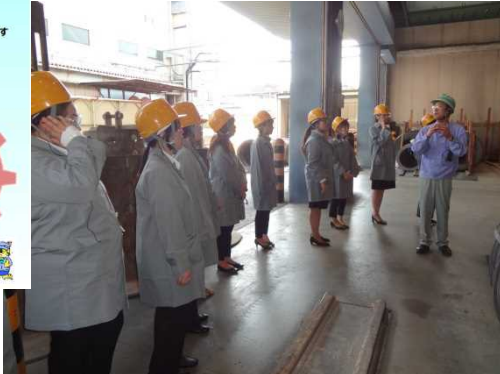
ものづくり会社見学会・説明会(墨田所)

多様化する求人・求職者ニーズに応えるべく、様々な観点からマッチングを促進する取組を実施しています！！