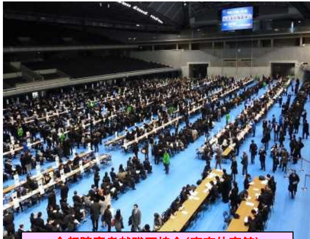
全都障害者就職面接会(東京体育館)

多様化する求人・求職者ニーズに応えるべく、様々な観点からマッチングを促進する取組を実施しています！！