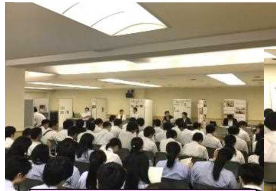
高校生のための企業説明会