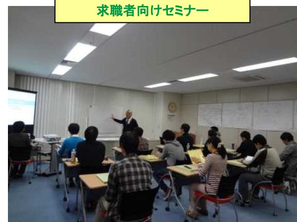
求職者向けセミナー