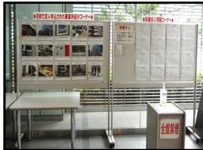
画像付き求人の掲示